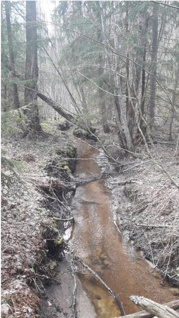
Suoristettua, luonnontilaisen kaltaista osuutta.