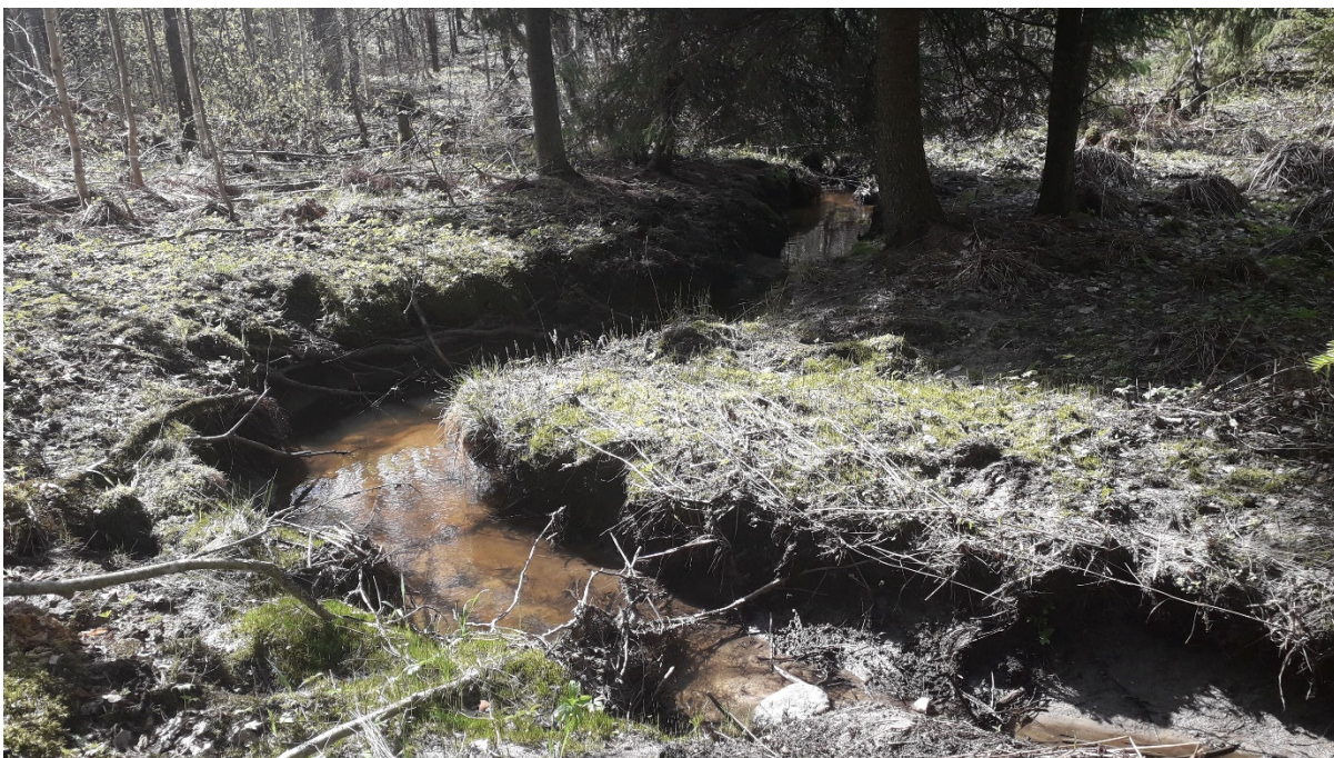
Pääuoman keskiosan virtaama on rauhallinen.