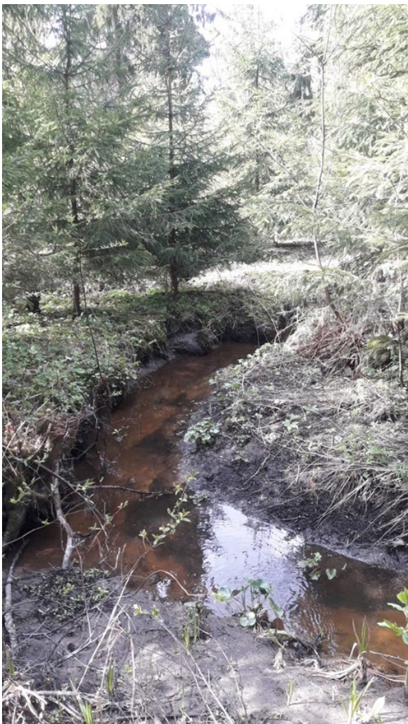
Uomaa alaosa juuri ennen peltoaluetta.