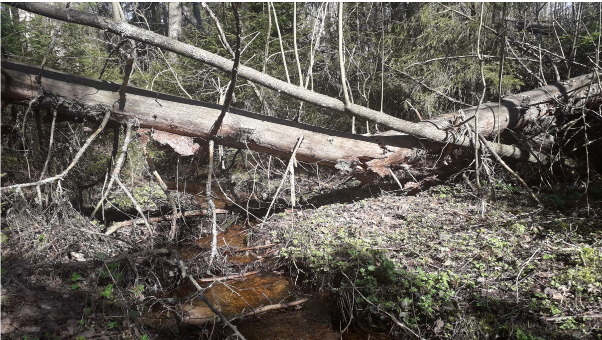
Noron alaosalla on runsaasti maapuuta ja lahoppuuta.