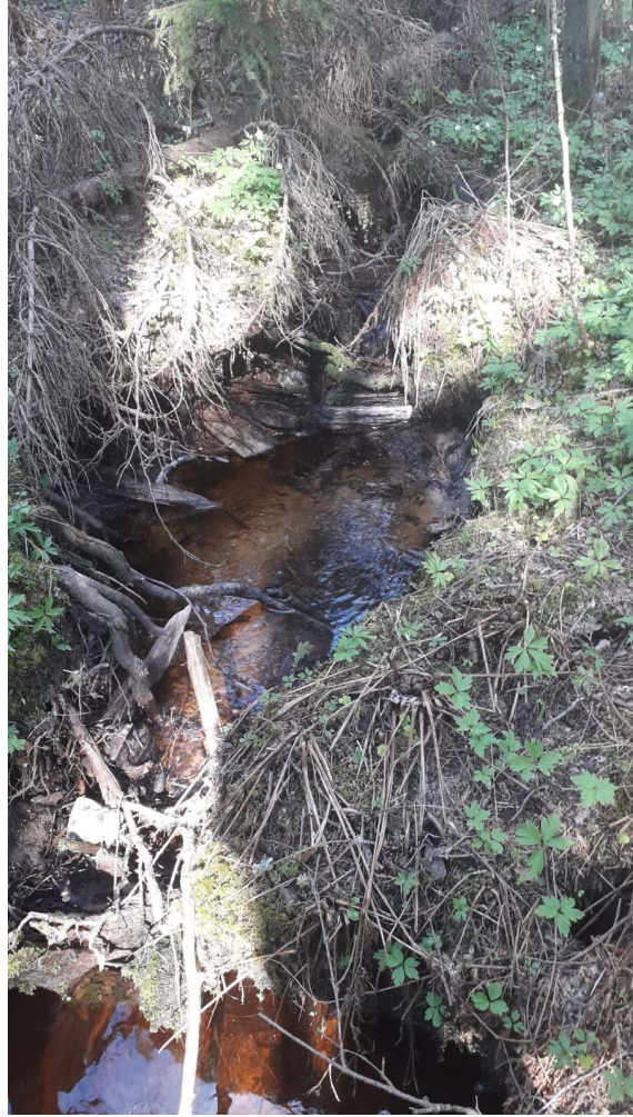
Noron alaosa on sorapohjainen.