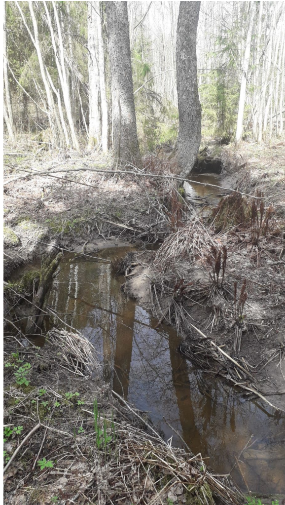
Uoman mutkittelua ja reunavyöhykkeen kasvillisuutta keskiosalla.