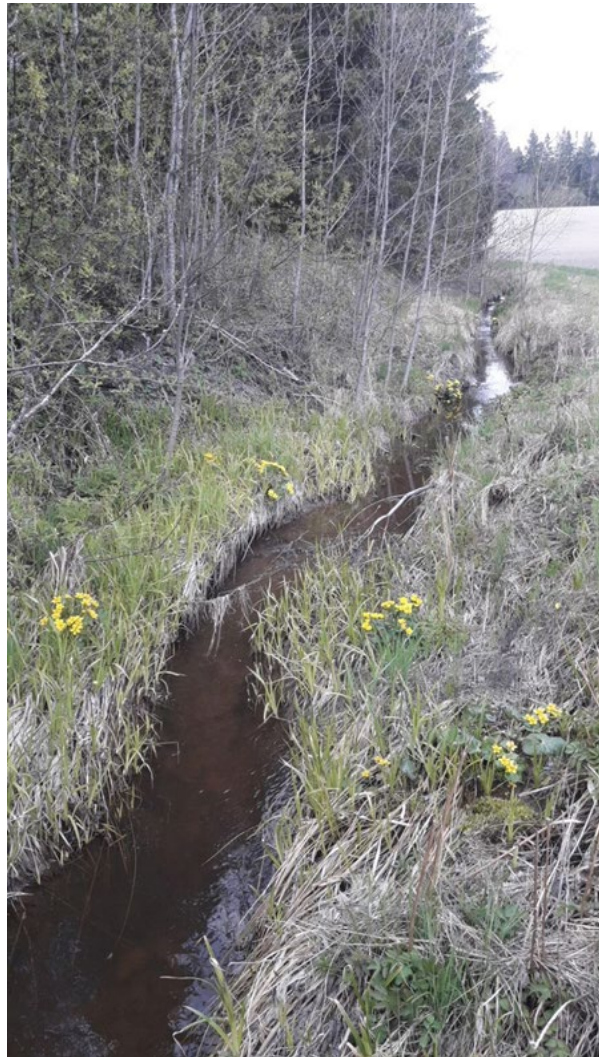
Peltoalueen luonnontilaisen kaltaista uomaa.