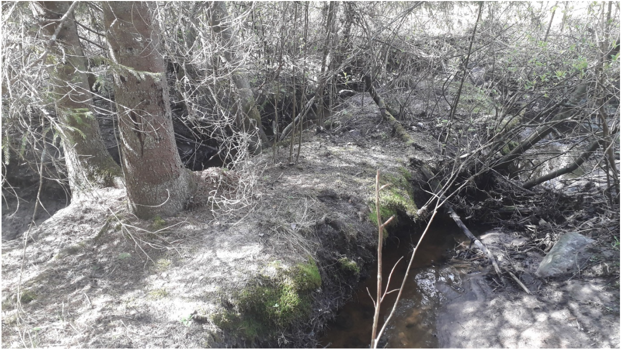
Ennen kivikkoista osuutta mutkat ovat erittäin jyrkkiä ja muodostavat niemiä.