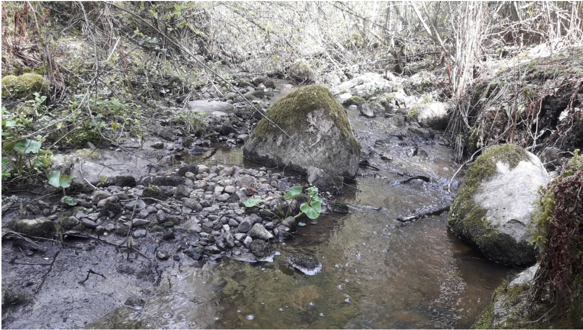
Uoman pohjan soraikkoa kivikkoisella osuudella.