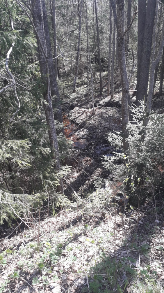
Noro Leikontieltä päin.